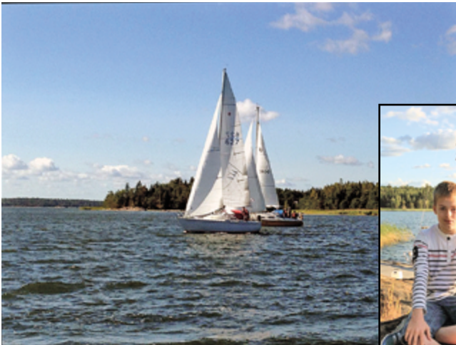
Ovan: Vackert väder och byig vind på Singösexan hösten 2015. T h: Sextimmarssegling passar för alla åldrar.

Oj vad det går undan. Humöret ökar. Med den här farten ska många poäng tas innan tävlingstiden är slut. Ska jag försöka hinna Vik, trots att det blir motvind på återvägen med en besvärlig kryss? Å andra sidan har Gorran tidigare ställt till med bekymmer på grund av opålitliga vindar. Jag väntar med valet tills jag passerat pricken vid grundet ”Farorna”. Ser där att andra båtar går inne i Gorran. Alltså, snabbt beslut, ner mot Stenholmen, som till min förvåning utan besvär kan glidas förbi ganska snabbt i lugnvattnet på insidan av färdriktningen. Detta går fint, nu till Månskär och vidare ner till den sydligaste udden på banan, stimulerad av att ha seglat om en av konkurrentbåtarna.