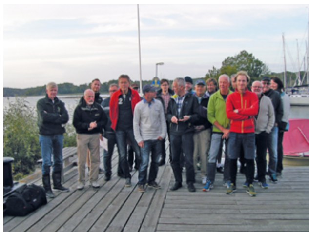
Deltagarna i Höstkvarten på Ekoln 2015.