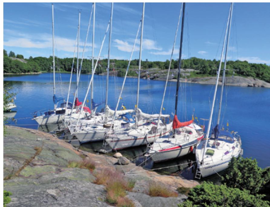
Eskadern på Björkö.

Efter Österskär seglade vi söderut, till Jurmo. På Jurmo hölls sedvanligt skeppsråd med introduktion av det traditionella schatullet (för att få veta vad