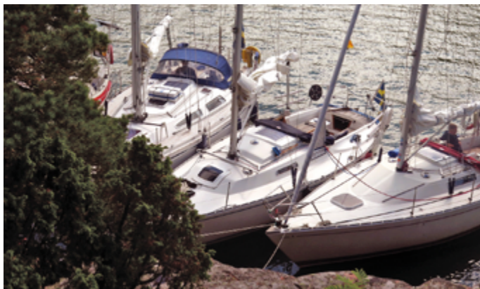
Längst in i Djupviken finns bra ankringsplatser.

bastu i en sprillans ny bastu som ligger på öns nordsida, det finns också ett trevligt kafé. Man har även en liten samling små träbåtar som kan vara intressant att se. Nästa anhalt blev Korpoström. Seglingen hit blev en ganska segdragen historia med avtagande vindar och bitvis ett stilla regn. Vi låg två dagar i Korpoström som har affär och trevlig restaurang som ligger alldeles nere vid vattnet. Här såg vi imponerade på en stor skuta som mycket skickligt manövrerades rakt in i hamnen och som lade till precis utanför hamnkrogen. Nu blev vädret sämre för oss som skulle segla västerut, med ganska hårda vindar. Eskadern (inte riktigt alla) vände när vi mötte hårda vindar ute på fjärden. Vi skulle gå till Lappo över en del mycket öppna vatten och väl tillbaka i Korpoström lades några alternativa färdvägar upp innan vi på nytt gav oss iväg. Nu gick det bättre och det blev en lång dag för flera båtar innan vi kom fram till Lappo. En trevlig gästhamn och här finns också en mycket bra krog som kan rekommenderas.