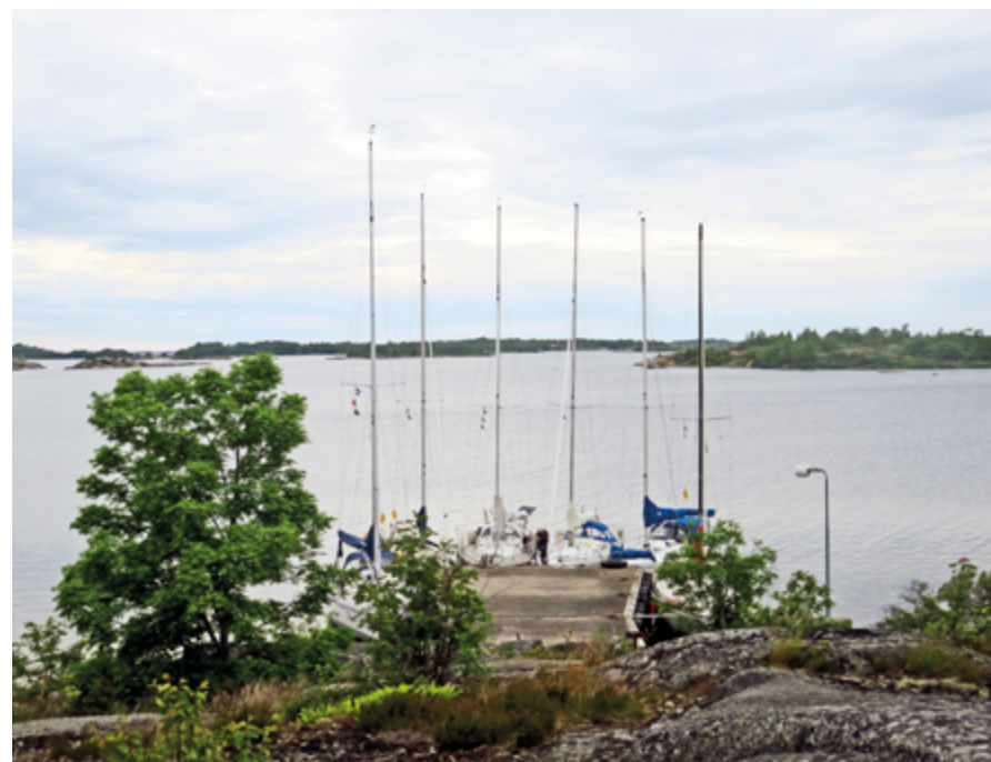
Uppsalakretsens Ålandseskader vid Långskärs brygga.